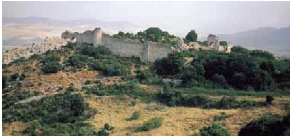
Fortificación y Castillo de Portilla.

Si algunos de estos castillos citados conservan gran parte de sus estructuras, que nos permiten sentirnos inmersos en sus momentos históricos, otros tuvieron peor suerte quedando únicamente algunos restos de lo que fueron. Sin embargo, su estratégica situación bien merece una visita al lugar donde estuvieron emplazados. Uno de estos casos es el de Bernedo , que conserva sus ruinas en la parte alta de la población. Su importancia como punto de control de los caminos del Ebro hacia el norte es manifiesta, al igual que los dominios territoriales en relación con el reino de Navarra.