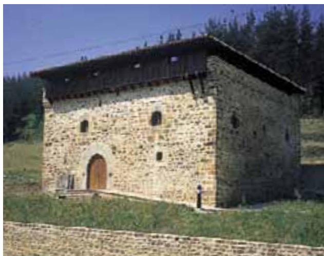
Torre del Valle o Negorta. (Zuaza)

Cerca, en un punto clave en las comunicaciones de la época, se halla la torre de Mendieta , un buen ejemplar de casa fuerte del siglo XVI. Recuerdan su carácter defensivo las troneras, saeteras y garitones. El escudo de la fachada pertenece a los Mendieta.