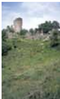
Castillo de Guevara. (Guevara)

Cerca del palacio y en la altura que domina un amplio territorio, se aprecian las ruinas de lo que fue el magnífico castillo de Guevara, edificado en el siglo XV por Iñigo de Guevara, conde de Oñate. Al igual que el palacio, al final de la primera Guerra Carlista, en 1839, la fortaleza fue destruida tras un asedio a las tropas de Don Carlos, que allí se habían refugiado. Hoy tan sólo se puede adivinar su trazado y los restos del torreón. Además, se puede entrar en las galerías abovedadas que hay en la parte baja de los muros. Merece subir hasta el lugar por la panorámica de la Llanada Oriental que desde allí se puede contemplar.