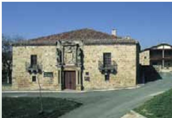
Palacio de los Lazárraga y Amézaga. (Zalduondo)

Otra significativa construcción es la Casa del Cordón. En su interior llama la atención la existencia de una torre gótica con un foso, edificada sobre parte de las defensas de Vitoria-Gasteiz en los siglos XIII y XIV y descubierta en una restauración en 1960. El palacio que alberga