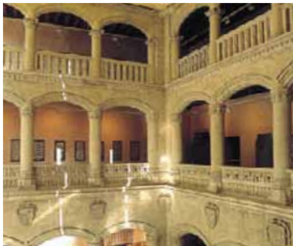
Palacio de Bendaña. (Vitoria-Gasteiz)