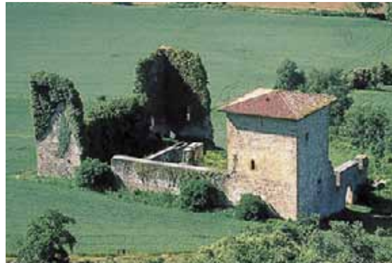
Palacio de los Guevara. (Guevara)

Junto al cerro de Estíbaliz, Oreitia conserva el palacio-fuerte de Guevara-Lazárraga datado a principios del siglo XVI. En la actualidad y tras las transformaciones sufridas, es un edificio de dos plantas. Su fachada está dominada por dos arcos de medio punto y en la parte alta dos escudos recuerdan a los fundadores. Las características del edificio marcan la evolución de las casas fuertes medievales hacia construcciones dedicadas principalmente a vivienda.