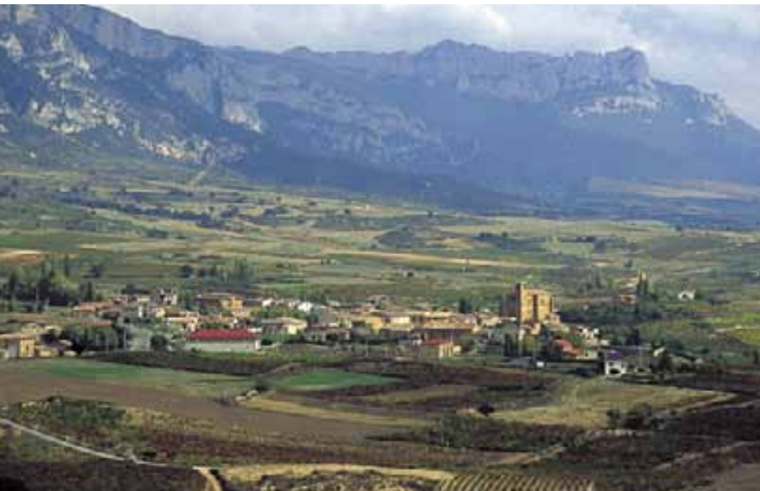
En la Rioja Alavesa los conflictos fronterizos entre Navarra y Castilla dieron lugar a la creación de castillos, villas e iglesias fortificadas. Uno de estos casos es el de Samaniego con su iglesia fortificada.

Si alguien, después de visitar Alava, habla de fosos, puentes levadizos, almenas, saeteras, barbacanas y troneras, no estará aludiendo a ningún cuento ni libro de aventuras, sino que seguramente estará contando los detalles de su visitas a las torres, castillos y casas solariegas que abundan en este territorio.