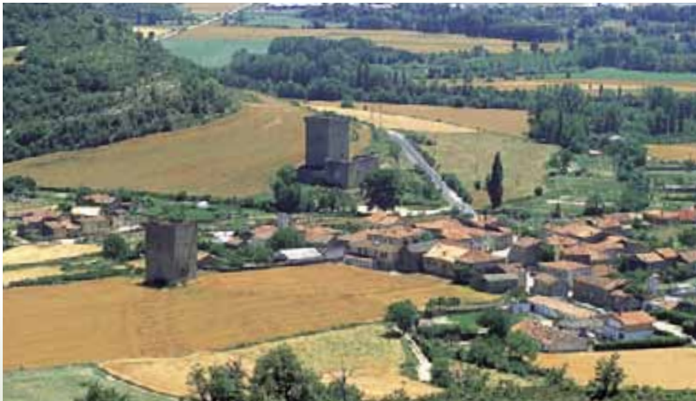
Castillo del Condestable y Torre de Orgaz. (Fontecha)

vacía. A pesar de ello, es una de las más bellas. Las saeteras de su parte alta, de 1,25 metros de altura y rematadas con arcos lobulados, son muy peculiares y no se encuentran en el resto de las torres de Alava. Todo el conjunto perteneció al señorío de los Hurtado de Mendoza. Construida con piedra de sillería, ha sido consolidada por lo que se encuentra en bastante buen estado. Aunque la torre ha visto desaparecer una de sus cinco plantas, aún conserva sus notas definitorias. Sobre la puerta principal del recinto, en el palacio, figura el escudo de los fundadores y un relieve de la Inmaculada.