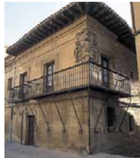
Casas solariegas. (Elciego)

Ponemos punto final a este recorrido por edificios con solera en Labraza . En esta localidad, destaca todo el conjunto por sus características de fortificación, aspecto acentuado por su ubicación en lo alto de un cerro.