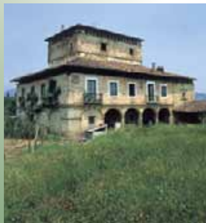
Palacio y torre de los Murga. (Murga)

Murga cuenta con un palacio y una torre que se alzan junto al río Izoria. El palacio de los Murga, familia que tuvo gran peso en la zona,