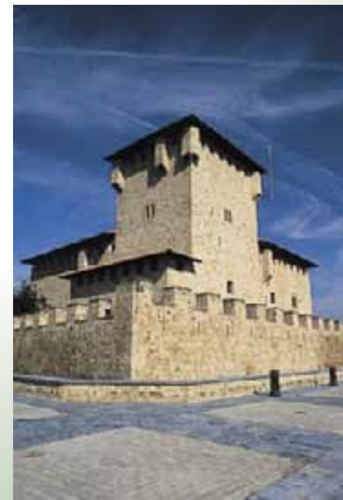
Torre-Palacio de Los Varona. (Villanañe)