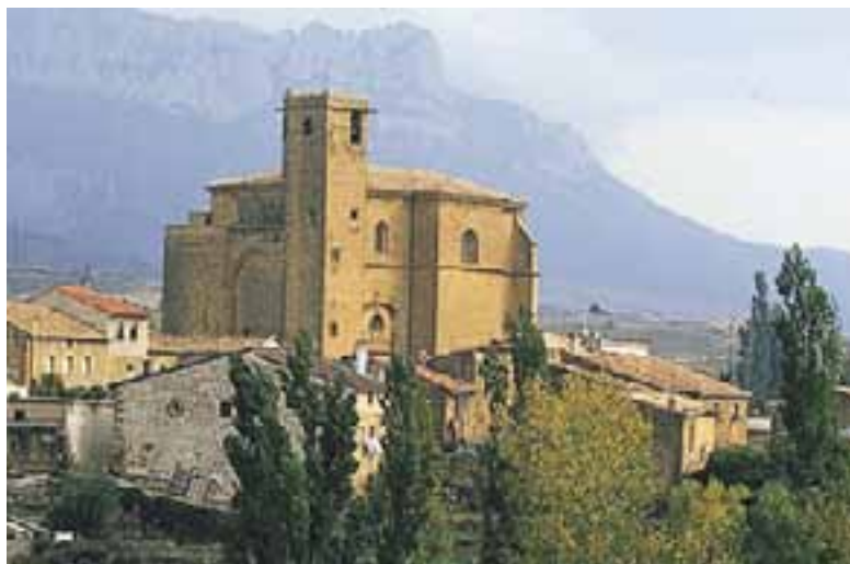
Iglesia-fortaleza de la Asunción. (Samaniego)

Comenzamos por Labastida , villa en la que llaman la atención las casas solariegas que, aderezadas con sus blasones, jalonan la calle Mayor. Algo similar ocurre en Samaniego , donde las viviendas que pertenecieron a los linajes nobiliarios evocan tiempos pasados. Se pueden ver escudos que siempre muestran en uno de sus paneles las armas de los Samaniego. En esta localidad llama la atención también la iglesia