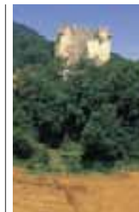
Castillo de Nograrro.

Parte de la Cuenca del Ebro se ve flanqueada por edificios medievales de gran importancia en la historia de Alava. Destacan las torres de Fontecha . La del Condestable, exenta, cuenta con almenas y la piedra armera de los Solorzano. Su interior está vacío. Más importante es la Torre de Orgaz, que forma un conjunto junto con el palacio del que le separa un patio. El palacio se levanta en una inclinación del terreno y la torre ocupa la parte más alta. El conjunto, edificado en sillería, ha sufrido transformaciones. Esta torre que, como el palacio, es de planta rectangular también se encuentra