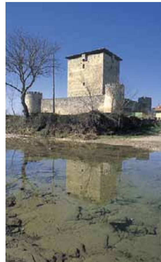
Torre de los Mendoza, en el pueblo del mismo nombre.

A poca distancia se alza, en lo alto del pueblo de Mártioda , la torre de los Hurtado de Mendoza, algo posterior pero también del siglo XIII. Cuenta con el atractivo de estar rodeada por un foso y una muralla por tres lados, ya que el flanco norte estaba suficientemente defendido por lo abrupto del terreno. Desde el punto de vista estético, conserva detalles góticos en ventanas y saeteras. En el siglo XVIII sufrió grandes transformaciones al convertirse en palacio. Estamos ante un caso de torre militar convertida en casa de labor y centro de un núcleo de población.