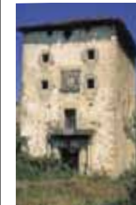
Torre Zubiete. (Llanteno)

El palacio, la construcción más antigua de todo el conjunto, fue fundado por Fernán Pérez de Ayala en el siglo XIV. Este inmueble, destinado en parte a Museo monográfico sobre los Ayala, y en el resto como alojamiento de la comunidad religiosa, conserva parte de su antiguo esplendor. En el siglo XVIII fue reformado, pero aún se puede ver que al principio cumplió la doble misión de fortaleza y casa de los Ayala. Es un edificio cuadrangular que estuvo flanqueado por cuatro torres de las que en la actualidad solo se conserva una. El patio interior se distinguía por su galería y arcos, eliminados en la restauración de los años 80. Por su parte, la torre-capilla, también del siglo XIV, es una fortaleza de gran prestancia, dotada de almenas desde las que se contempla una dilatada panorámica. Tiene forma cuadrangular y se accede a ella a partir de un patio porticado. La capilla dedicada a la Virgen del Cabello se