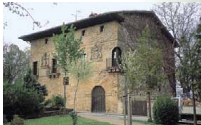
Casa señorial de los Azcárraga. (Salvatierra)

Algunas villas conservan tanto el carácter defensivo de su conjunto como las numerosas casas solariegas de las familias que en ellas habitaron. Este es el caso de Salvatierra . Aunque destruida su muralla, en las Guerras Carlistas, de la que aún quedan algunos lienzos, se mantiene este carácter de fortificación en sus dos iglesias, Santa María