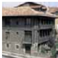
Casa de los Gobeo-Guevara-San Juan. (Vitoria-Gasteiz)