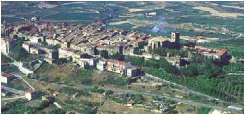
Villa de Laguardia, con su trazado medieval defendido por la muralla.

representados por los Ayala, eran Gamboínos y querían que los nobles contribuyesen al fisco, al contrario que los Calleja, que estaban en la línea de los Oñacinos.