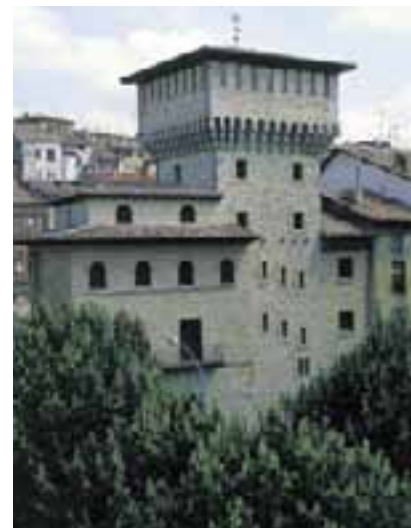
Torre de los Iruña, conocida como de Doña Otxanda. (Vitoria-Gasteiz)