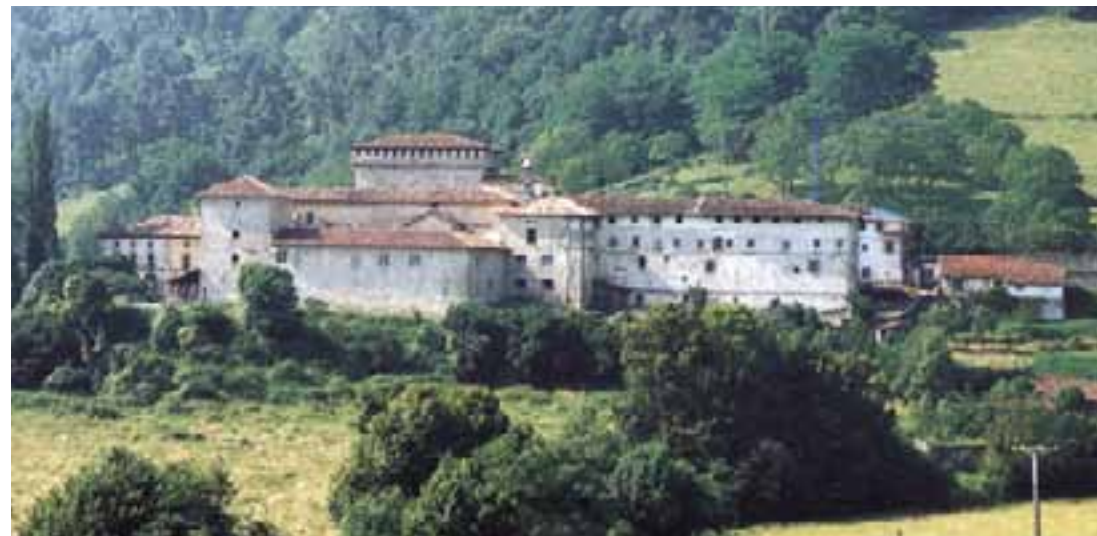
Conjunto del palacio, castillo y monasterio de Los Ayala. (Quejana)

es del XVI y tiene la peculiaridad de que rodea una torre del XIV que tuvo una marcada finalidad defensiva. Su puerta principal es de arco apuntado y está situada a cierta altura. Por su parte, en el palacio sobresale la arquería de su planta baja.