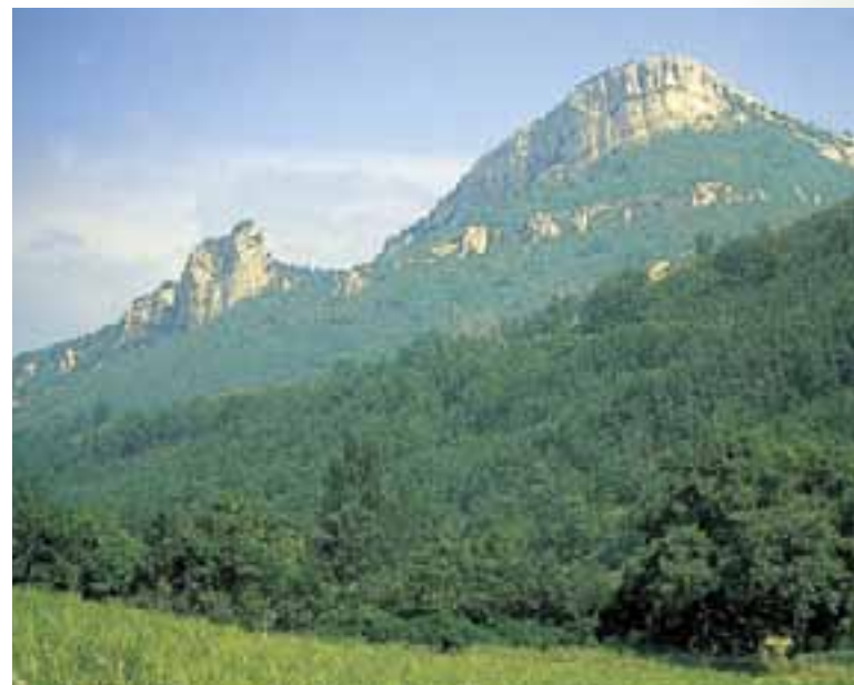
En lo alto de la Peña de la Izquierda se alza el castillo de Portilla.

Las luchas banderizas afectaron a toda la sociedad vasca, incluso en el interior de las villas. Atraídos por los privilegios que éstas ofrecían, destacados linajes se trasladaron a estos núcleos y allí se produjeron los conflictos. En el caso de Vitoria-Gasteiz, dos familias rivales -Los Ayala y los Calleja- encabezaban un enfrentamiento motivado por el pago de impuestos por parte de los nobles. Los oficiales y menestrales,