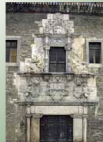
Palacio de Escoriaza-Esquível. (Vitoria-Gasteiz)

De una época posterior es la casa-palacio del Marqués del Fresno, cuyos orígenes se enraizan en el siglo XVII si bien la decoración de la fachada es del XVIII. Sobresalen los escudos de Maturana y Verástegui y el arco conopial de su acceso. Ya dentro del estilo barroco del siglo XVIII, se edificó el palacio de los Urbina-Zarate, en parte sobre las antiguas murallas de la ciudad.