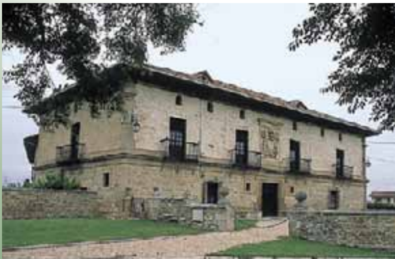
Palacio de Otazu. (Zurbano)