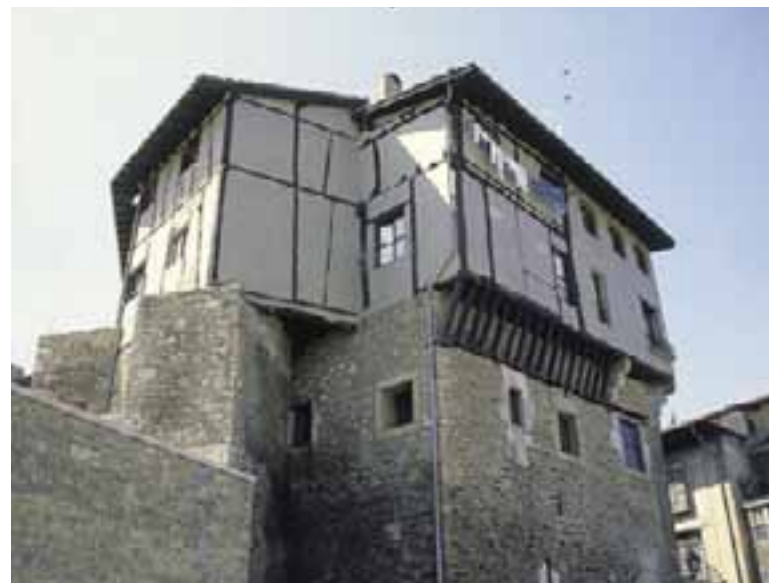
Torre de Los Anda. (Vitoria-Gasteiz)