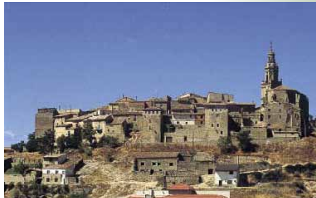
Muralla este de la villa de Labraza.