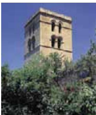
Torre Abacial. (Laguardia)

Muy cerca de la plaza del Castillo, se yergue la Torre Abacial, de carácter militar, construida en dos épocas distintas: la primera, entre el XII y el XIII, es románica de transición mientras que la segunda, entre el XIII y el XIV, se enmarca en el gótico. Esta torre se alza, exenta, en el lado oeste de la iglesia de Santa María de los Reyes, a la que sirve como campanario.