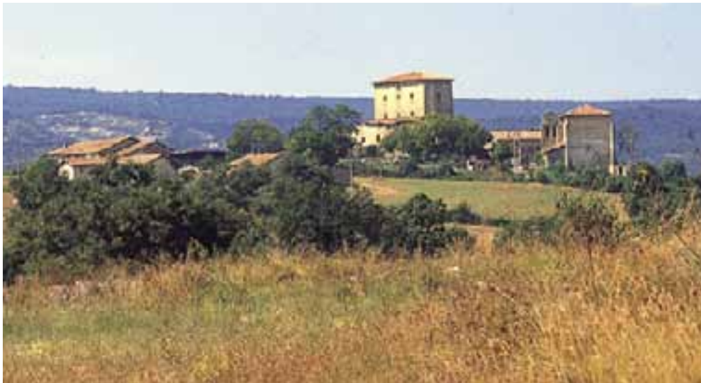
Torre de los Hurtado de Mendoza. (Mártioda)

En la Llanada Oriental, en Guevara , el edificio más representativo pertenece al palacio de los Guevara, un recinto amurallado de finales del XIII o principios del XIV, hoy en ruinas, con cuatro torres de planta cuadrada en sus esquinas.