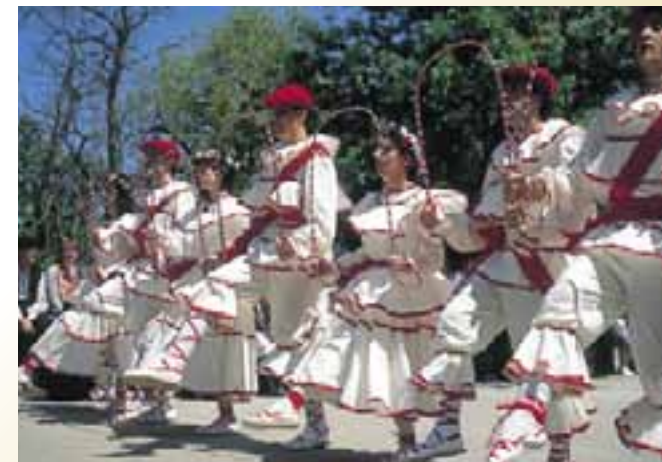
Danzas típicas de Laguardia.

A finales de febrero tiene lugar habitualmente la