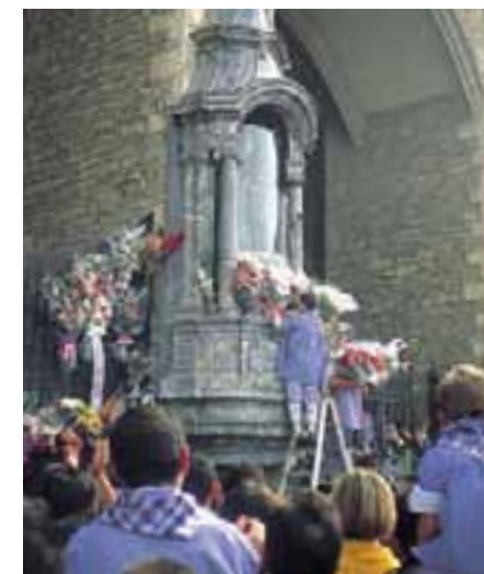
Blusas ofrendando flores a la Virgen Blanca. (Vitoria-Gasteiz)

Al día siguiente, festividad de la Virgen Blanca, tiene lugar el Rosario de la Aurora que congrega en la calle a varias decenas de miles de personas a primeras horas de la mañana. En esa jornada la hornacina de la patrona, situada en el exterior de la iglesia de San Miguel, se ve cuajada de ramos de flores y en su honor los blusas bailan un aurreku.