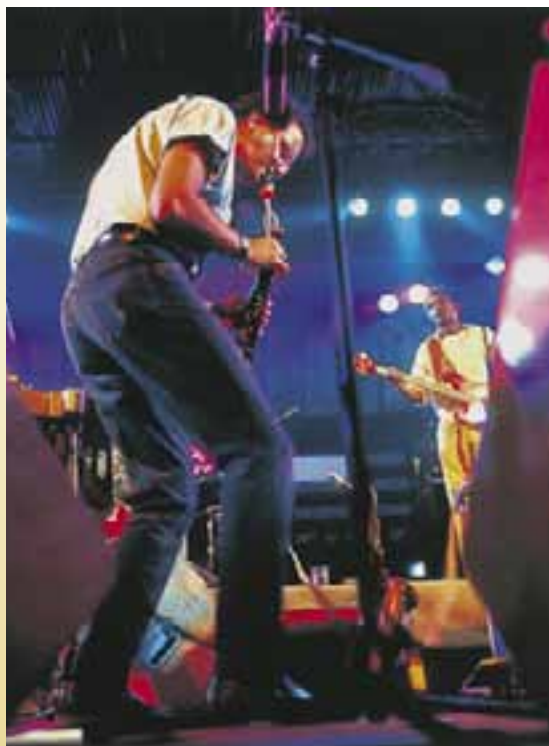
Festival Internacional de Jazz. (Vitoria-Gasteiz)

En junio , los dos últimos fines de semana, artistas de diversas disciplinas muestran su trabajo a los viandantes con el programa "La Calle para los Artistas".