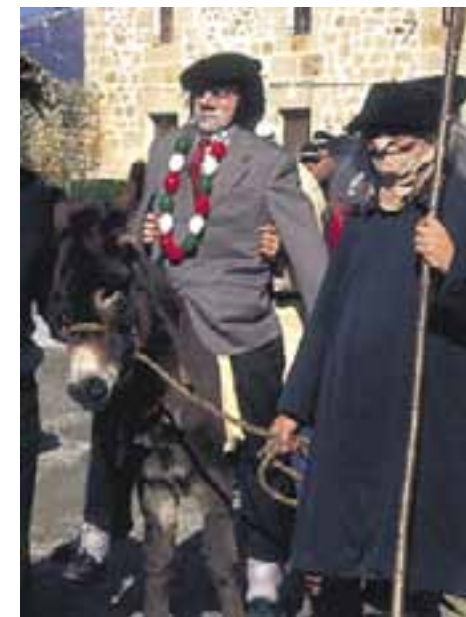
Carnaval de Zalduondo.

El carnaval rural es muy sonoro. A ello contribuyen cencerros, matracas, campanas... que acompañan la pelea y el triunfo final de Doña Cuaresma sobre Don Carnal.