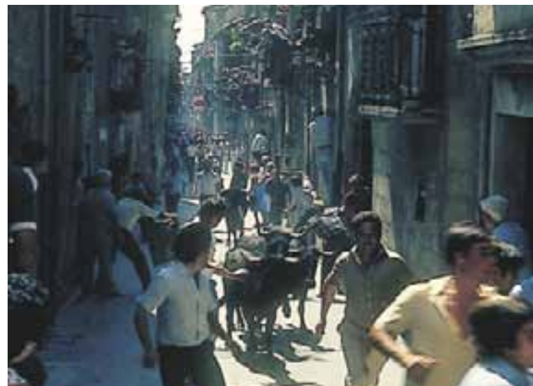
Encierro por la calle Mayor de Laguardia.

San Juan, la comitiva recorre las casas del alcalde y el regidor síndico con la bandera de Laguardia. Reunidos todos en la plaza, se baja desde el balcón la bandera de Laguardia, haciéndolo de pie para que no se incline en ningún momento. Se hace la ofrenda del ramo de flores a las autoridades. La comitiva de bailarines presenta un aspecto multicolor;