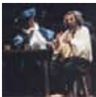
El Festival Internacional de Teatro, tiene lugar en el Teatro Principal de Vitoria-Gasteiz.

En fechas variables se celebran otros acontecimientos culturales. Asimismo, el año se salpica de montajes de Opera y Zarzuela.