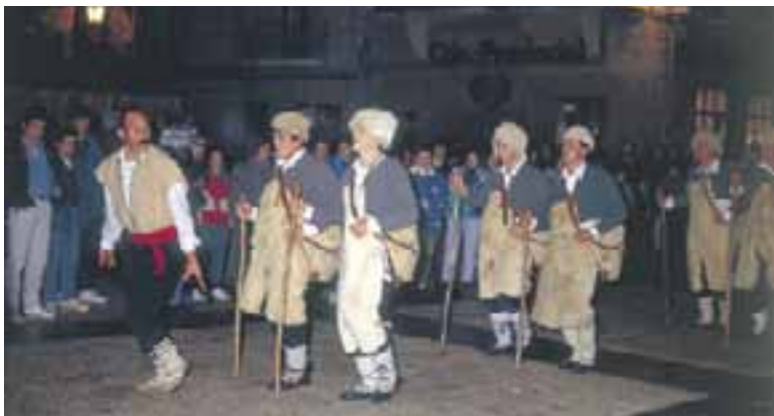
"Danza de los Pastores". (Labastida)

La Nochebuena se vive intensamente en Labastida donde tiene lugar la "Danza de los Pastores" durante la Misa del Gallo. Estos, cubiertos con pieles y acompañados por el "Cachimorro", reciben el aviso del ángel y corren a comunicar la buena nueva al Ayuntamiento. Allí bailan y cantan y, acompañados por el pueblo y las autoridades,