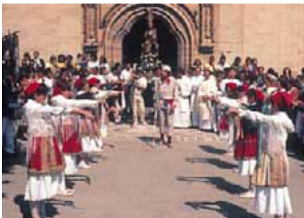
Danzas en honor de la Virgen de la Plaza. (Elciego)

Al final de este mismo mes, el día 29, se celebra en Laguardia la fiesta de “San Juan Degollao” . Especialmente significativa es la danza de los “Troqueados”, de corte guerrero. Otras muestras del folklore, también presentes en esta fiesta, son las danzas de los “Arcos” y la “Jota de Laguardia”. La animación musical y los encierros conforman dos platos fuertes del programa.