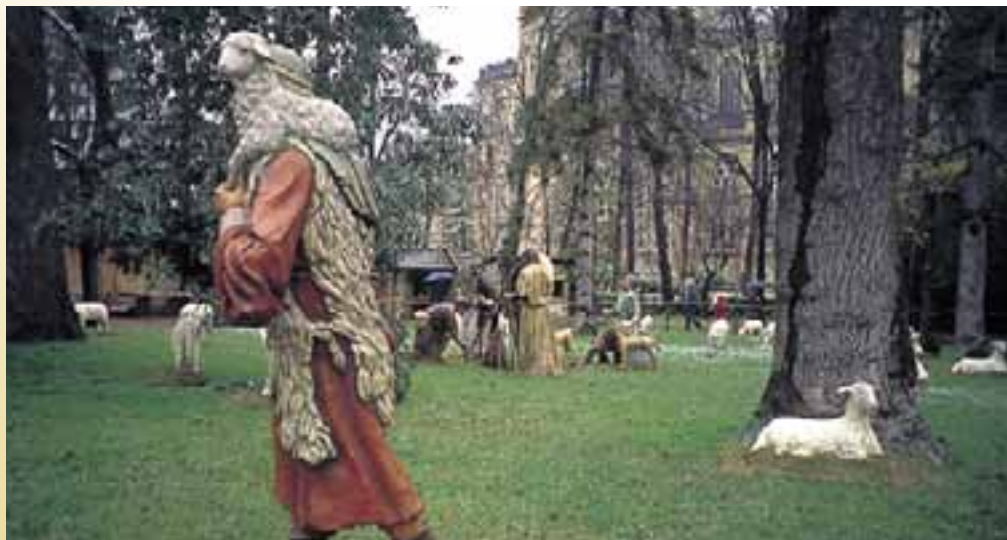
Belén monumental en el parque de La Florida. (Vitoria-Gasteiz)

La Nochebuena se vive intensamente en Labastida donde tiene lugar la "Danza de los Pastores" durante la Misa del Gallo. Estos, cubiertos con pieles y acompañados por el "Cachimorro", reciben el aviso del ángel y corren a comunicar la buena nueva al Ayuntamiento. Allí bailan y cantan y, acompañados por el pueblo y las autoridades,