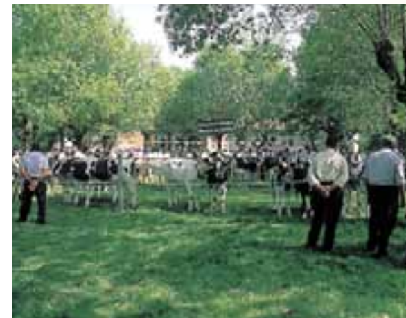
Feria de San Isidro. (Respaldiza)