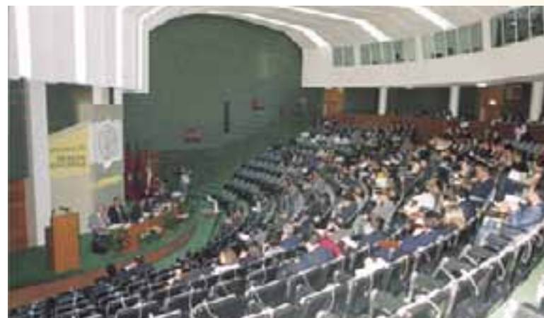
Palacio de Congresos Europa. (Vitoria-Gasteiz)

Por último, no se pueden olvidar los numerosos congresos de variadas disciplinas que se celebran en Vitoria-Gasteiz durante todo el año, contando para ello con el Palacio de Congresos Europa y las instalaciones de la Casa de Cultura, además de otras salas en el palacio medieval de Villa Suso y el Centro Cultural Montehermosos y las que existen en otros edificios de corte hostelero. Hasta tal punto que ya es un hecho el eslogan de "Vitoria-Gasteiz, Ciudad de Congresos".