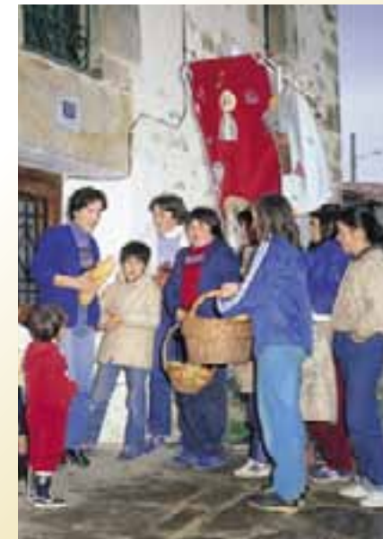
Fiesta de la Banderita.

Como se puede comprobar, las variantes de estas celebraciones son múltiples al igual que las canciones que se entonan. Por señalar una más, en Ayala los pequeños llevan una jaula con un gallo en su peregrinar por las casas. La llaman " Fiesta del Gallo ", con lo que al final el animal es el plato principal de la merienda. El origen de esta fiesta, que en algunos lugares se traslada al sábado siguiente, es cristiano. La merienda basada, en productos del cerdo, era una preparación para afrontar la Cuaresma. El nombre de Jueves de Lardero es el habitual en la Llanada y la Montaña Alavesa aunque en otros sitios ha sido bautizada como Carnestolendas y Egunzuri.