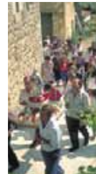
Procesión de "San Fausto". (Bujanda)

Nada más comenzar el mes, llegan las fiestas de la Virgen Blanca , patrona de Vitoria-Gasteiz. Estos festejos que se celebran entre los días 4 y 9, tienen como nota principal la participación popular. La fiesta se vive en la calle desde el inicio hasta el final y las posibilidades de diversión son muchas.