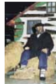
El "Olentzero" anuncia la Navidad.

Todas estas fiestas y costumbres y otras muchas son reflejo de la cultura que, siglo tras siglo, han ido forjando los alaveses y que hoy conservan con esmero como algo vivo.