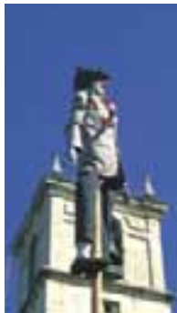
"Marquitos" empalado. Carnaval de Zaluando.