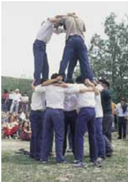
Formando "El Castillo" en la romería de La Trinidad. (Guillarte)

En la víspera de San Juan, en San Vicente Arana, cortan ramas de hayas o robles que son colocadas por todas las casas del lugar, teniendo lugar el encendido de la hoguera al día siguiente.