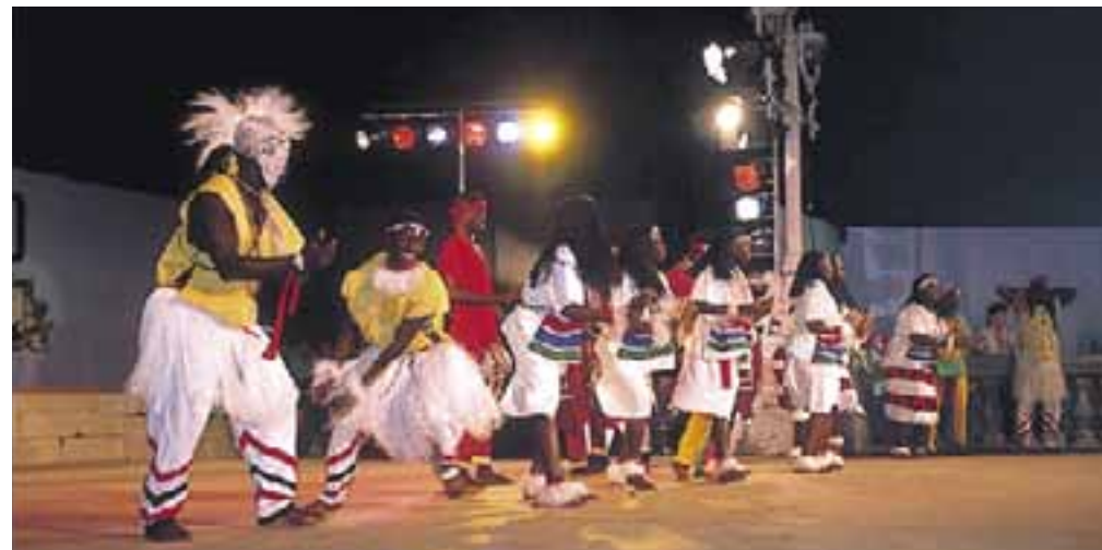
Festival Internacional de Folklore.

En julio , hacia la segunda semana, llega uno de los actos más esperados del año: el Festival Internacional de Jazz de Vitoria-Gasteiz. Estas jornadas jazzísticas han ido aumentando su calidad a lo largo de las edicio-