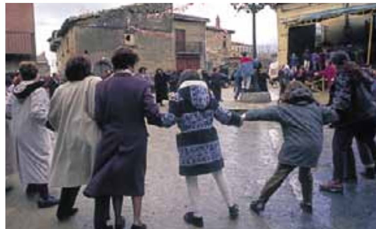
Baile del “Chulalai”. (Páganos)

rosca en el brazo derecho. A su término se celebra una misa en la que se bendicen los dulces, panes y frutos. Luego, todos los vecinos reunidos en corro bailan “La Tarara” también llamada “Marmarisola”. Por la tarde acuden los habitantes de Laguardia que, tiempo atrás, también celebraban esta fiesta en su localidad. Lo más significativo es la danza del “Chulalai”, en la que todo el pueblo forma un gran círculo compuesto por hombres y mujeres intercalados. El choque de caderas y los movimientos al ritmo de la música constituyen un buen divertimento para los participantes. También se besa la reliquia del Santo y, como no podía faltar el componente gastronómico, son habituales las meriendas de sopas con chorizo, tortilla, hojaldre y vino rojo.