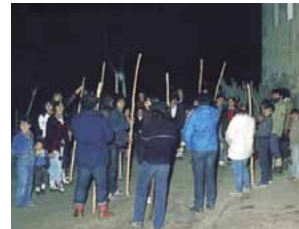
Coros de Santa Agueda.

Sin tiempo para el respiro, llega la fiesta de Santa Agueda , el 5 de febrero. Lo más notable de esta festividad tiene lugar la víspera, cuando en todo Alava grupos de jóvenes recorren en ronda nocturna pueblos y ciudades. Entonando la clásica canción de Santa Agueda, acompañada de rítmicos golpes con makilas, solicitando donativos, en metálico o en especie, para celebrar una merienda. Los jóvenes van ataviados con la indumentaria típica en la que no puede faltar la txapela, el kaiku o la blusa, ni las albarcas.