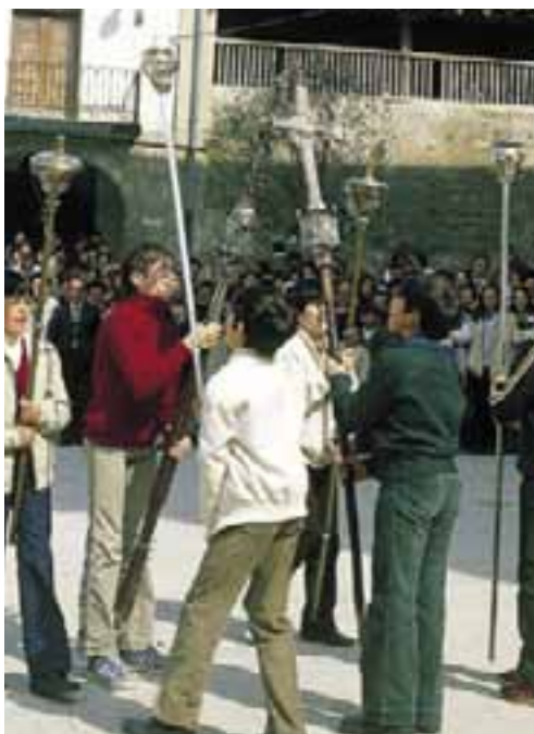
Procesión del domingo de resurrección con el "Beso de las Cruces". (Salinas de Añana)