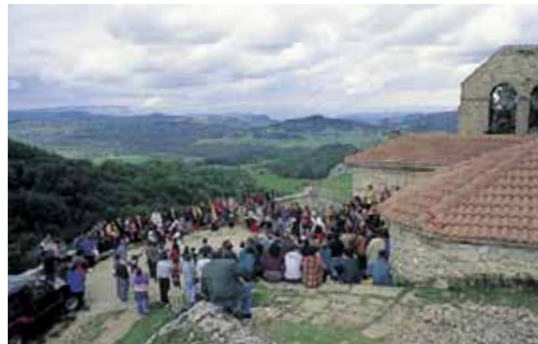
Romería en el Santuario de Ntra.Sra. de Oro. (Valle de Zuia)