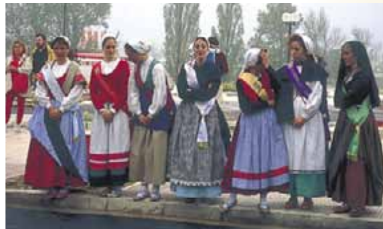
Representantes de las Cuadrillas Alavesas, en la fiesta de San Prudencio y Ntra. Sra. de Estíbaliz.