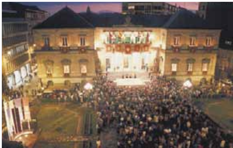
Retreta de San Prudencio, en la plaza de La Provincia. (Vitoria-Gasteiz)

a cabo la tradicional Retreta en los balcones del Ayuntamiento y la Diputación. Se trata de unos toques interpretados por clarineros y atabaleros que recuerdan los que siglos atrás anunciaban el cierre de las murallas de la Ciudad. Hoy son una llamada que anuncia la fiesta e invita a unirse a esa alegría.