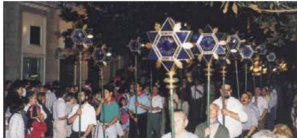
Procesión de los Faroles. (Vitoria-Gasteiz)

y se encienden incontables puros que provocan una gran humareda. Una vez en tierra, Celedón se llena de vida y, en plena explosión de júbilo, recorre a pie la plaza para saludar a los vitorianos y visitantes desde la balconada de San Miguel y declarar inauguradas las fiestas. Se produce entonces una explosión de alegría que no cesa hasta la una de la madrugada del día 10, hora en la que entre fuegos artificiales Celedón, invirtiendo su viaje de llegada, regresa a la torre hasta el año siguiente.