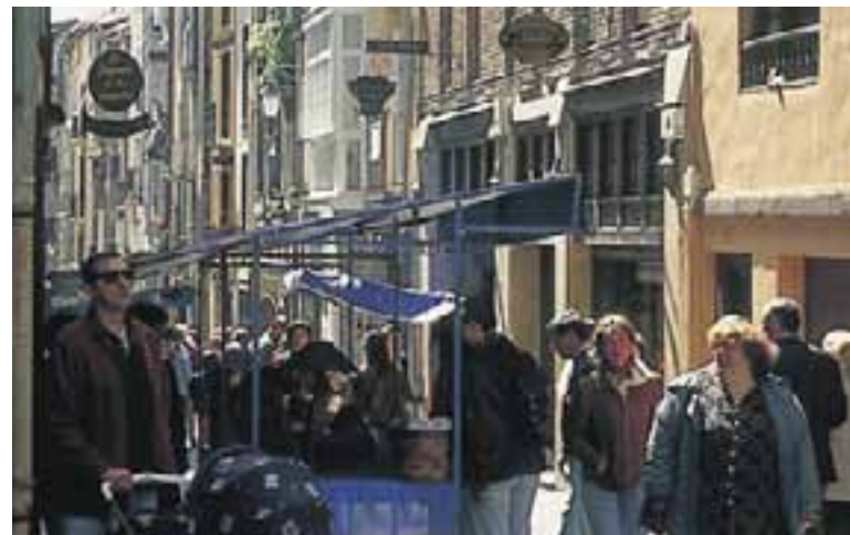
Mercado en el Casco Viejo. (Vitoria-Gasteiz)

Todos los primeros sábados de cada mes, se celebra el "Mercado del Casco Viejo", que además de la actividad comercial, incluye actos culturales de muy variada índole, desde visitas a edificios significativos del Casco Medieval, hasta representaciones de teatro o marionetas y actividades musicales.