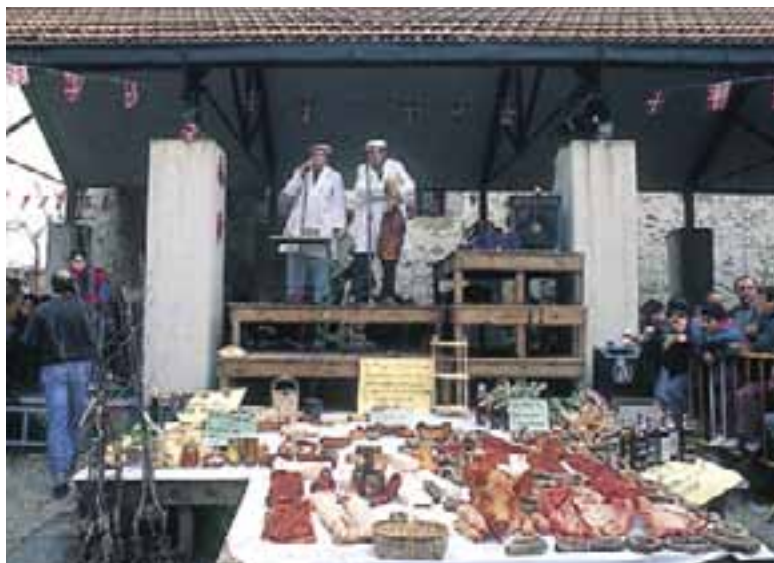
San Antón. (Amurrio)