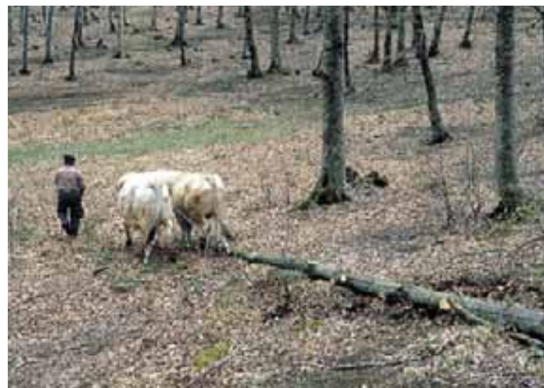
Traslado del haya para la fiesta de "El Mayo". (San Vicente de Arana)