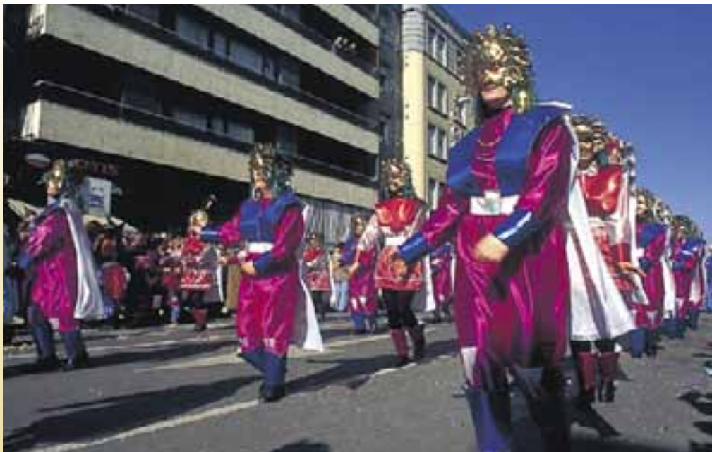
Carnaval en Vitoria-Gasteiz.

Paralelamente, se celebran concursos de disfraces, conciertos y verbenas y la animación en las calles está asegurada. La "Quema de la Sardina" pone fin a una fiesta que gozó de gran auge en el siglo pasado y en las primeras décadas del siglo XX y que en la actual etapa fue restaurada en 1977.