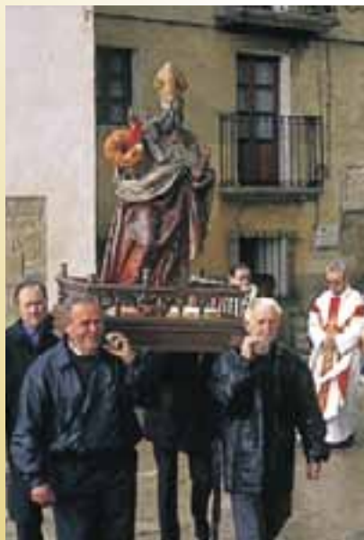
San Blas. (Páganos)

En la víspera de San Blas, tras la celebración de un acto religioso, a primeras horas de la noche se enciende una hoguera en la plaza y el Ayuntamiento obsequia a los vecinos con vino caliente. Al día siguiente se lleva a cabo una procesión presidida por la imagen del santo, al que se le coloca una