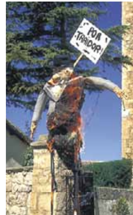
Quema del Judas. (Lagrán)

Llegamos así al 28 de abril, festividad de San Prudencio , patrón de Alava. Los actos de la jornada se extienden a todo el territorio con las más diversas actividades. Sin embargo, Vitoria-Gasteiz y la cercana Armentia concentran lo más tradicional del programa, compuesto tanto por festejos religiosos como profanos. Días antes de San Prudencio, se pronuncia el pregón, que suele correr a cargo de un personaje popular. Asimismo, se celebran concursos de cata de vino y de elaboración de platos típicos. También tiene lugar una novena. Ya en la víspera del día 28, se lleva