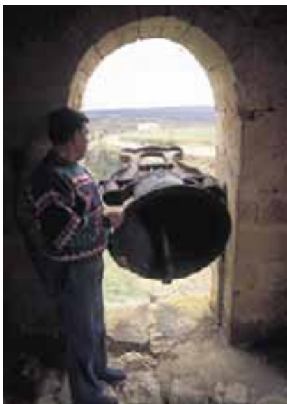
Toque conjurante de campanas, llamado "Tentenublo"

Hace años, en la noche del 4 al 5 de febrero se tocaban las campanas con el fin de conjurar los males. Uno de los pocos sitios en que se conserva una modalidad de esta costumbre es Moreda de Alava. En esta localidad, a primeras horas del día de Santa Agueda, los mozos en quintas recorren las calles vestidos con capas azules y dejan oírse al son de guitarras y bandurrias. La comitiva se detiene en algunas esquinas y plazas y, tras un toque de corneta o un repique de tambor, se leen una letrillas a modo de pregón. Al igual que en las rondas nocturnas celebradas la víspera en otras localidades, en Moreda de Alava también piden donativos para una comida o cena. Por un día los mozos tienen los poderes del concejo y asumen los cargos del alcalde y concejales.