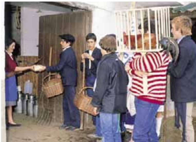
Fiesta del Gallo.

En determinados lugares los pequeños van disfrazados y uno de ellos aparece vestido de obispo en representación de San Nicolás de Bari. Se conoce como " Fiesta del Obispillo ", con especial desarrollo en la Llanada Oriental y los valles de Arana, Campezo, Arraya y Laminoria. Esta misma fiesta se celebra en algunos pueblos el 6 de diciembre, día del mencionado Santo. En Labastida la fiesta se conoce como " Jueves de Todos ", mientras que en Zuia, Cigoitia y Cuartango recibe el nombre de " Fiesta de la Banderita " porque los niños portan a modo de estandarte una tela blanca en la que se colocan dibujos y fotos.