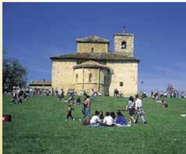
Romería de San Prudencio. (Armentia)

A continuación tiene lugar la primera cita gastronómica de las fiestas, con especial relevancia en las Sociedades Gastronómicas. En la cena no pueden faltar los perretxikos y caracoles, máximos exponentes culinarios de esta celebración. Luego llegan las tamboradas de las sociedades que con su inconfundible sonido anuncian la cercanía del día del Patrón. El día 28 está protagonizado por la romería hasta Armentia y su Basílica de San Prudencio. Según la tradición, en este lugar distante de Vitoria-Gasteiz unos tres kilómetros, nació el que luego se convirtió en patrón de