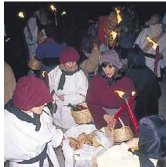
Carnaval de Salcedo.

Zalduondo destaca por su carnaval rural , célebre en Euskalherria ya que reúne todos los elementos de esta fiesta en el entorno rural. El protagonista es "Markitos", un muñeco que representa todos los males y que es paseado, empalado, juzgado y quemado. Todo el pueblo participa en estos actos y algunos vecinos se encargan de representar a animales como ovejas, lobos, osos y personajes como el "Viejo y la Vieja". El cortejo pasea por el pueblo a Markitos que, montado en un burro, recibe las recriminaciones de todos. En la plaza, en una mascarada, un predicador acusa al personaje en un sermón burlesco, condenándole al fuego.