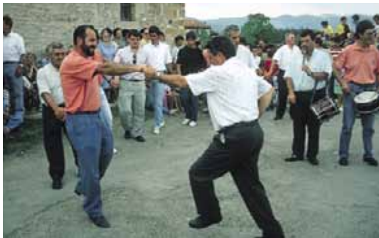
Baile tradicional en la fiesta del "Barte". (Hermua)

En medio de estas celebraciones patronales, tiene lugar la fiesta del "Barte" , de gran arraigo popular. El día 4, "Día del Barte", lo celebran los vecinos de Larrea en la ermita de San Martín, ubicada en la vecina