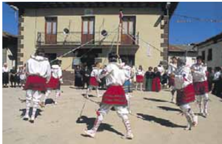
Danzantes de Pipaón.

Otras zonas también tienen danzas que se siguen bailando en la actualidad: Maestu, la de “San Adrián”; Salinas de Añana, la de “San Isidro”; Aramaio, el “Txakoli”; Pipaón, el “Trokeao”; Guillarte, la “Trinidad”, etc.