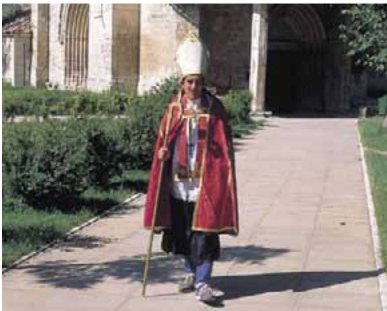
Fiesta del "Obispillo". (Salvatierra)

junto con otros procedentes de la matanza del cerdo. De ahí el nombre de la fiesta ya que "lardero" hace referencia a esta grasa porcina.