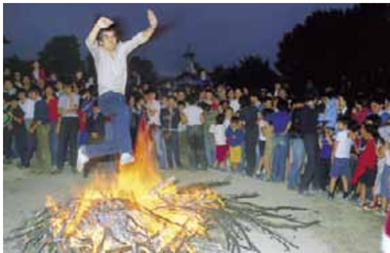
Hogueras de "San Juan".

La festividad del Corpus Christi ha tenido un puesto de honor entre todas las celebraciones a juzgar por los testimonios conservados. Actualmente sigue vigente con esplendor en la localidad de Marquínez, donde en la procesión que sigue a la misa van los representantes de la antiquísima cofradía de los " Nobles Ballesteros e Hijosdalgo", portando sus ballestas ornamentadas recubiertas de flores.