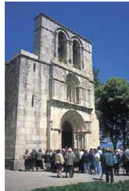
Fiestas de Ntra. Sra. de Estíbaliz.

La fiesta del Mayo tiene lugar el día 3 en el Valle de Arana, en concreto en el pueblo de San Vicente de Arana. Previamente a la fiesta, el Mayo ha sido derribado y llevado a la plaza donde lo descortezan hasta convertirlo en un poste. En este árbol -a menudo un haya- se colocan algunos símbolos como dos espadas de madera en forma de aspa, una cruz de cera, un paño blanco a modo de banderín, un palo que forma una cruz