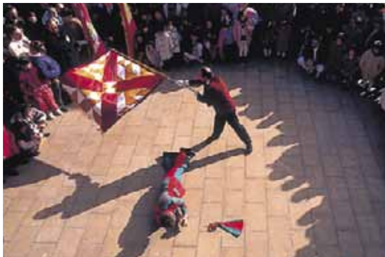
Revolcón de “El Cachi”. (Oyón-Oion)

Patronos”. Desde hace tres siglos, el personaje central de estas fiestas, el Cachi, realiza con su traje multicolor el rito de revolcarse por el suelo mientras ondea sobre él la bandera de la localidad. Primero cumple la tradición en el pórtico de la iglesia, como prólogo a la celebración de la misa. Después, tras la procesión en cuyo recorrido tienen lugar las famosas danzas, el Cachi se revuelca de nuevo por el suelo ante el Ayuntamiento.